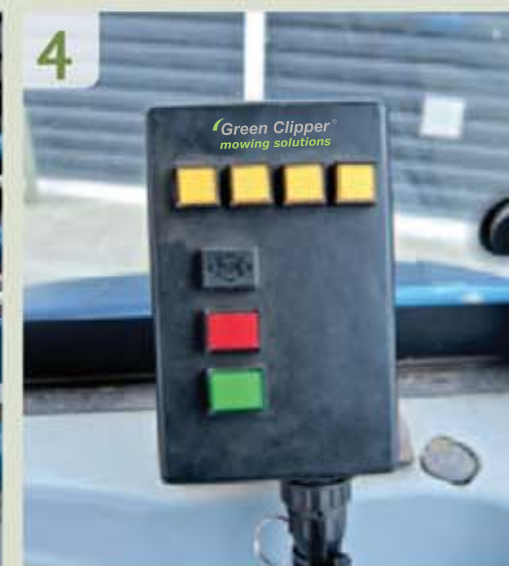
Bilder 1 - 4