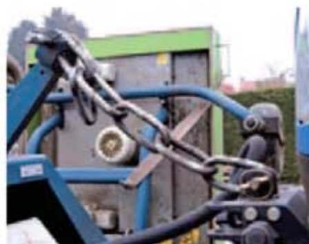
Eine Kette anstelle der Top-Stub sorgt der Mähmaschine Konturen folgen kann.