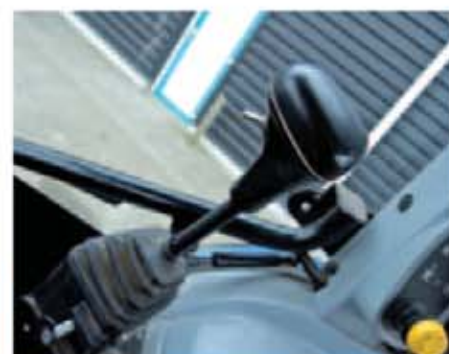
Auf dem Kreuzhebel von Den Hollander Traktor ist ein Schalter.